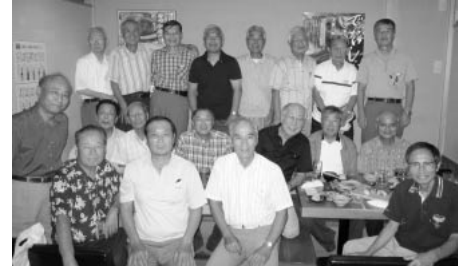
平成23年8月千葉市内で幹事会

対象は前回の実施に続き昭和43年卒～同45年卒業生としました。「勧誘文書・会報・活動案内パンフ・アンケートはがき等」を同封し約100通発送しました。本部会報がお手元に届く平成24年3月までには該当する卒業生宅に届いている筈です。是非ご検討頂き入会して欲しいものです。