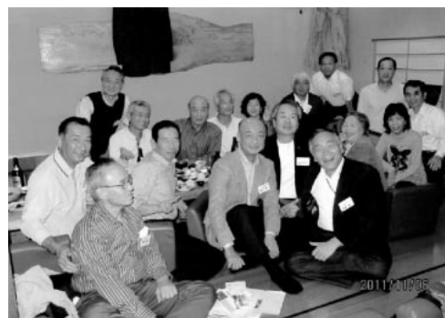
2011年11月6日 千葉駅前「日本海」にて

そんな先生を囲んで、2011年11月6日千葉駅前「日本海」にてバレー部OB達が集まり、先生の慰労会を含め、又学生時代プレー中にミスで監督に頭をたたかれたりした良き思い出を語りながら沢山酒を飲み、二次会では先生のカラオケを聞きながら大いに楽しみました。