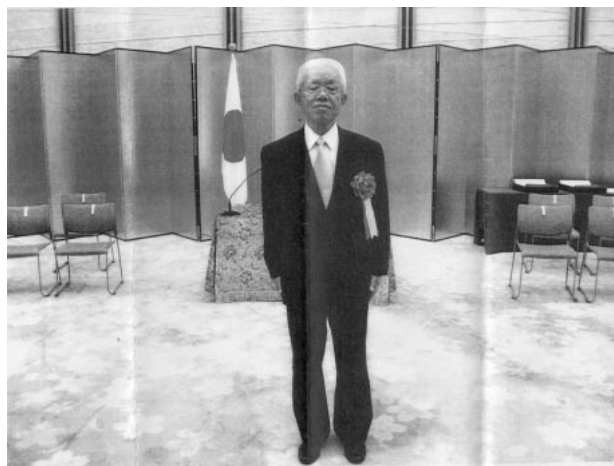
平成23年7月1日 総理大臣官邸大ホールにて

副会長職を経て平成2年5月に会長に推挙される。入会以来、「危険物に起因する災害の防止を図る」という協会の目的を達成するため、危険物の取り扱い及び管理技術の向上に努め、協会の発展に貢献するとともに、平成15年5月から(社)千葉県危険物安全協会連合会の監事を務めるなど安全管理の徹底と意識の高揚に多大な貢献をしている。