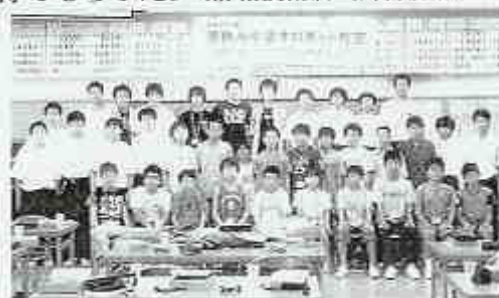
参加した中学生と講師の母校生徒たち

平成17年8月24日～26日、母校情報技術科実習室を会場に、「つくば科学万博記念財団ロボット学習普及活動団体」と「情報技術科」の合同主催による「夏休み中学生ロボット教室」が実施された。講師は、情報技術科の生徒と職員。中学生に「ものづくりの体験」をとおして、作る楽しさ・完成の達成感などを得てもらった。(情報技術科 相澤秀光)