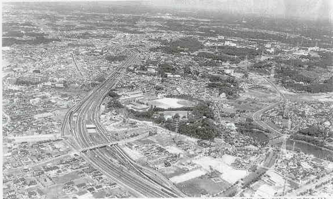
空から見た千葉工業（平成17年9月）