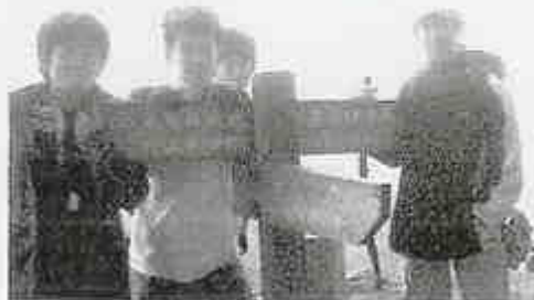
関東大会に出場した山岳部生徒

平成17年11月11日～13日、奥多摩山系(鷹ノ巣山)において開催された「第49回関東高等学校登山大会」に、母校山岳部(3年生1人・2年生3人)が出場した。県総合体育大会の上位入賞校が出場できるもので、関東各県の代表校が集まり交流登山をし、登山のすばらしさを満喫した。(山岳部顧問 増淵 守)