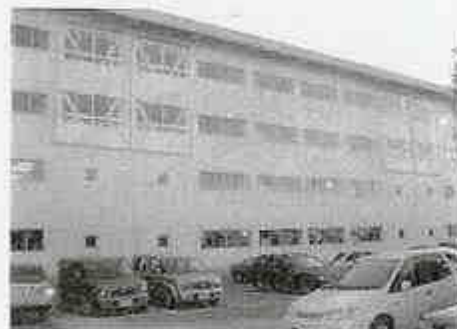
耐震補強工事で1・2階の廊下にてきた壁

平成17年7月から11月にかけて、母校教室棟の耐震補強・トイレの改修工事が行われた。教室棟の外壁にコンクリート耐力壁と鉄骨ブレスを設置し、震度7の地震にも校舎が耐えられるようになった。また、2階には身障者用トイレも新設された。