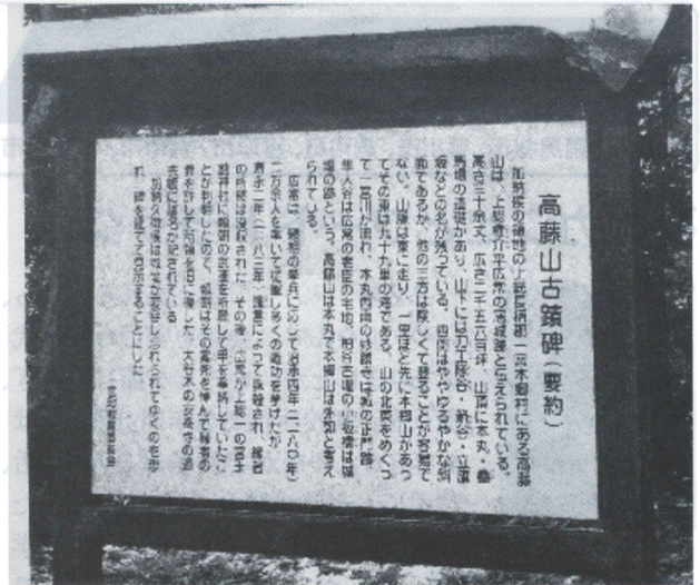
高藤山古蹟碑(要約)