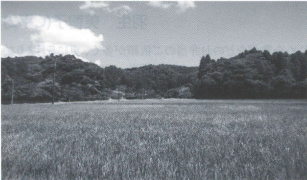
睦沢町岩井より高藤山城址遠望